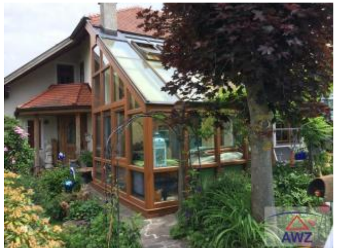
Terrasse zum Pool