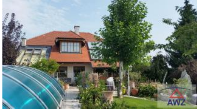
Terrasse mit Pool